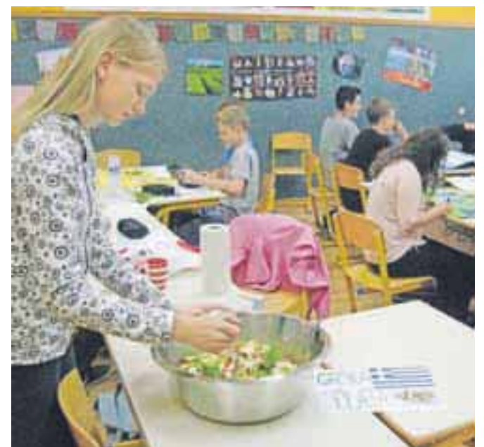
Učenci so grški jezik tudi »okušali« prek grške solate, ki so jo sami izdelali.

jezikov, saj so jih obiskali predstavniki društva Auris, niso pa pozabili niti na slovenski jezik, saj so se devetošolci posvetili slovenskim narečjem. Učenci so razen tega izdelali zastave evropskih držav in po šoli razobesili plakate z znanimi osebnostmi in zname-