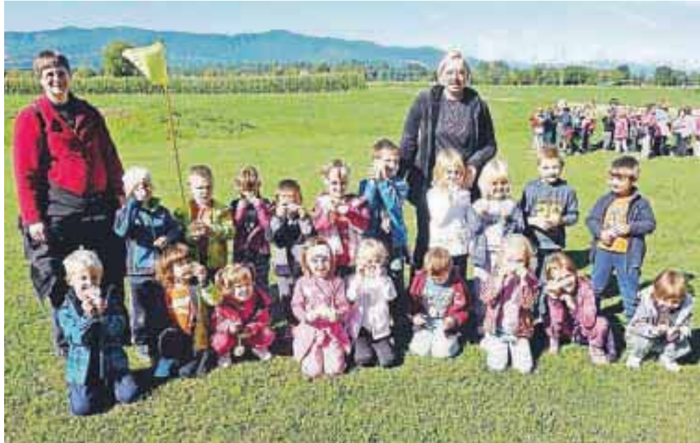
Vsi so bili zmagovalci.

cilj. Vsi so bili zmagovalci, ob koncu pa prejeli še medalje. Otroci so bili sproščeni, nasmejnani in ponosni na svoje uspehe.