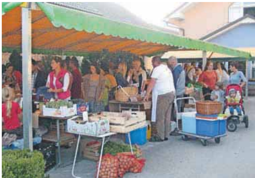
Ekološka tržnica ima nadstrešek, zato je lahko odprta tudi ob slabem vremenu.