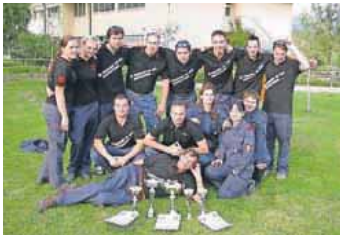
Skoraj v vseh kategorijah so slavili Podbrežani, na fotografiji je del njihove velike zmagovalne gasilske družine.

Regijsko tekmovanje za mladino bo 5. oktobra v Tržiču, za člane pa 12. oktobra v Kranju. Najuspešnejše ekipe GZ Naklo, ki so se uvrstile v nadaljnje tekmovanje, so: med pionirji zmagovalna ekipa PGD Podbrezje, pionirji PGD Naklo z osvojenim drugim mestom in ekipa PGD Duplje, ki