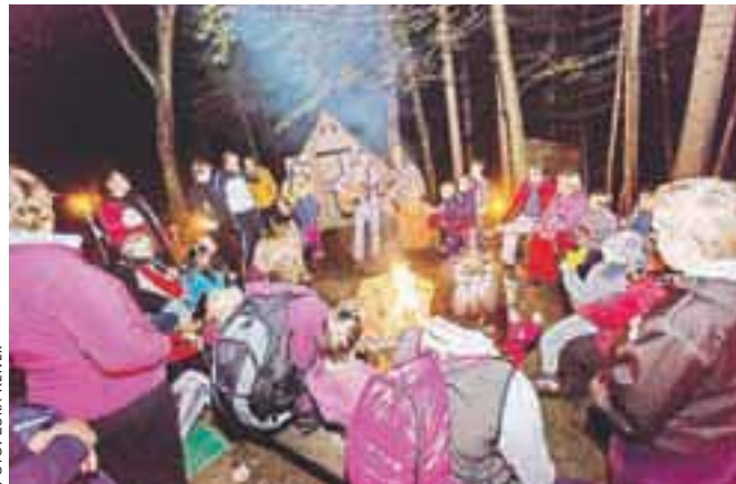
Pravljico-glasbeni večer v rokovnjaškem taboru