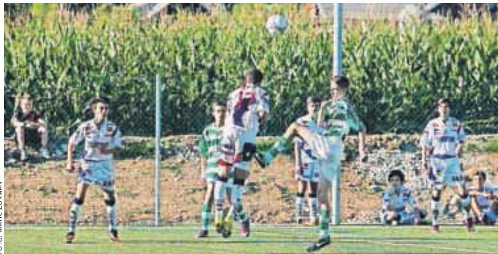
Prvo tekmo so na novem igrišču odigrali domačini NK Naklo proti gostom iz Celovca.