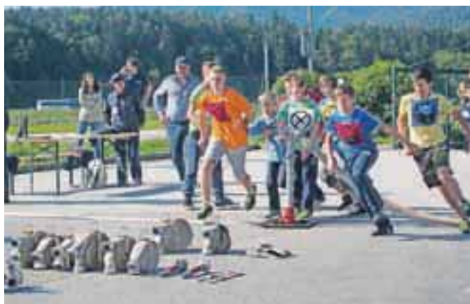
Med mladinci je slavila ekipa PGD Duplje.