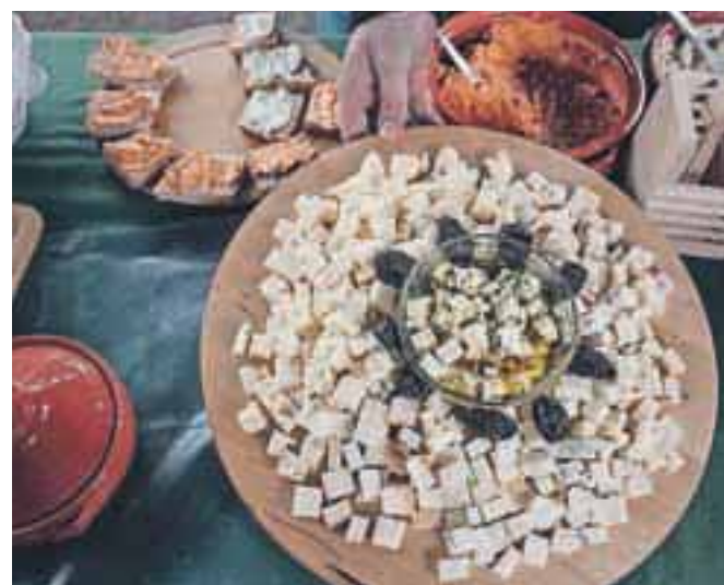
Vse kmetije, ki so sodelovale pri vikendu doživetij, so se izkazale kot gostoljubne. Obiskovalcem so pripravile pokušine podeželskih dobrot, posnetek na fotografiji je s Poličarjeve kmetije.