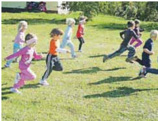
Vsi otroci so se trudili po svojih zmožnostih in pritekli na cilj.

ločili, da nadaljujemo s programom Mali sonček. Mali sonček je gibalni/športni program, ki je namenjen predšolskim otrokom, njegov namen pa je spodbuditi željo, navado in potrebo po gibanju. Tako smo na sončno dopoldne organizirali Jesenski mini kros, v katerem so sodelovali otroci treh oddelkov v starosti od treh do pet let. Razdelili smo se v tri skupine, se ogreli in pripravili na start. Da je bilo vzdušje še bolj športno, smo poskrbeli z glasnim navijanjem in spodbujanjem. Dolžina proge je bila primerna starosti