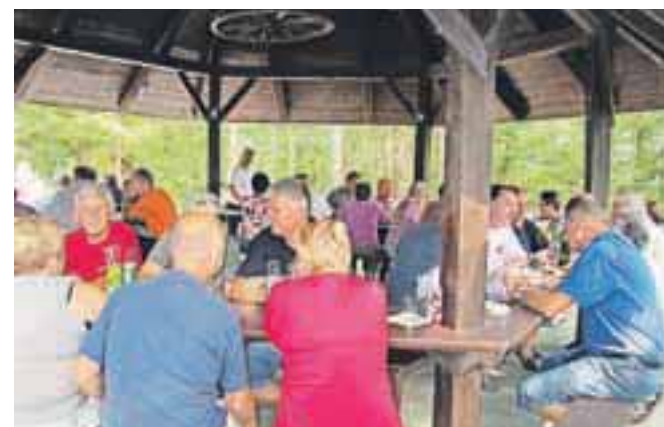
Člani dupljanskega Združenja za vrednote NOB na družabnem srečanju