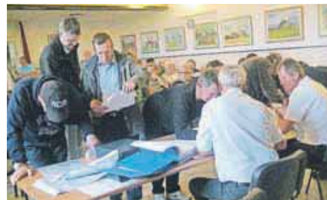
Predstavitev projekta gradnje kanalizacije na zboru krajanov

Na zboru krajanov v Podbrezjah je bila predstavitev gradnje primarnega kanalizacijskega voda. Bager bo prvič zakopal predvidoma do sredine oktobra.