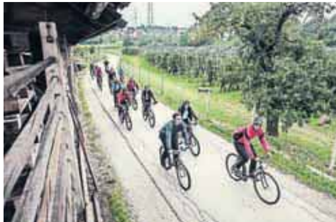
Kolesarjenje po podeželju nakelske občine